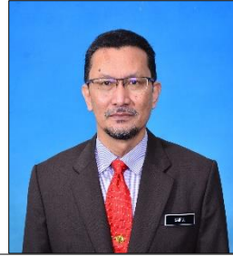
YBHG. DATUK SERI SAIFUL ANUAR BIN LEBAI HUSSEN Ketua Pengarah (Turus III)